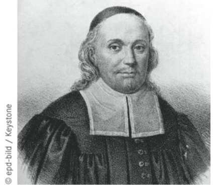
Kupferstich Paul Gerhardt (1607–1676), lutherischer Theologe und Dichter 17. Jahrhundert; aus der Bildersammlung des evangelischen Predigerseminars in der Lutherstadt Wittenberg

Eigenes Leid bleibt dem Ehepaar nicht erspart. Nach nur acht Monaten stirbt im Januar 1657 ihre erste Tochter. Drei weitere Kinder müssen die Gerhardts dann in Berlin nach nur